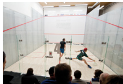
Gdańsk FITNESS AUTHORITY - 5 kortów

Dołącz do inwestorów, którzy nam zaufali: w ciągu ostatnich lat zbudowaliśmy w Polsce 80 kortów McWIL: