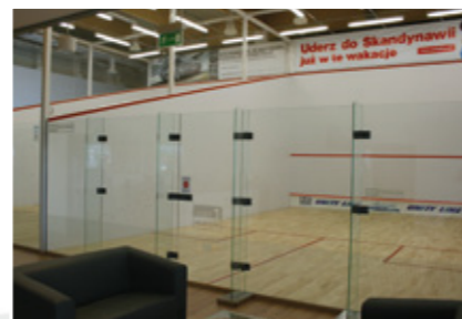
Szczecin SquashZoneClub - 4 korty